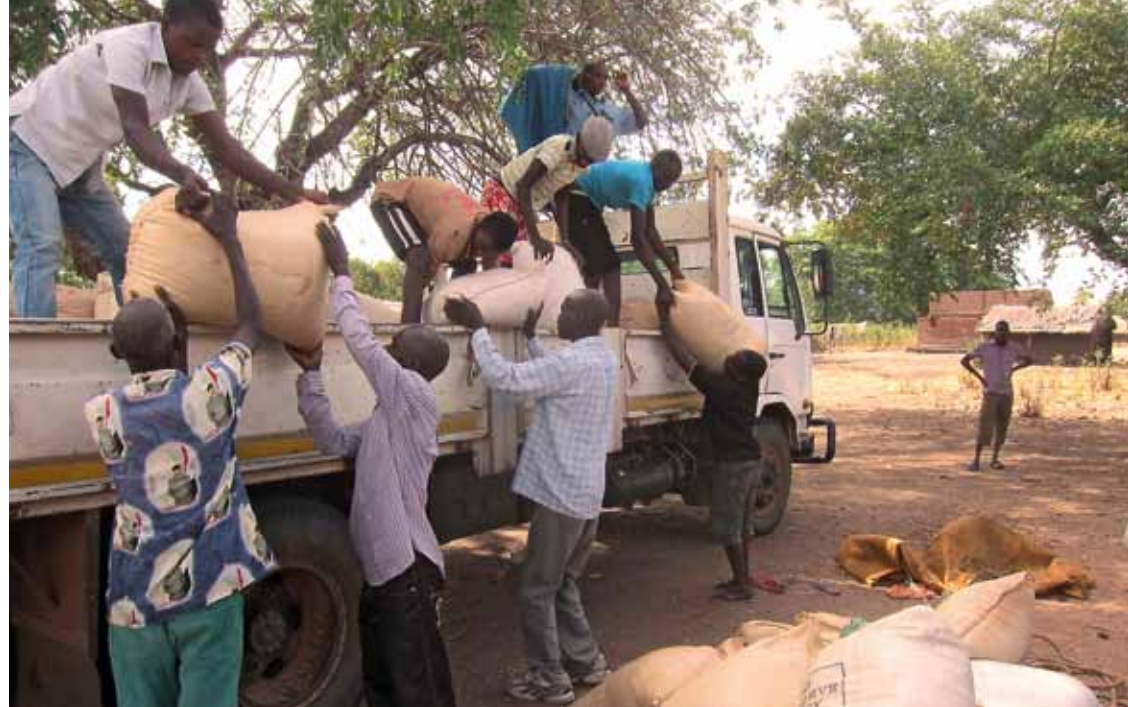
Alle packen an, damit der Mais schnell verteilt werden kann. Umgehend werden die Portionen für jede Familie bereitgestellt.