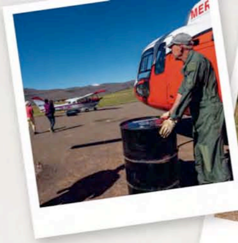
MEJAMETALANA AIR BASE IN LESOTHO, WO MAF UND MERCY AIR HAND IN HAND ARBEITEN.

Ein MAF-Flugzeug deponiert zwei Fässer Flugbenzin für den Mercy Air-Helikopter.